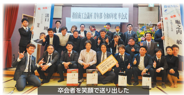
卒会者を笑顔で送り出した

最後に、卒会者より別れの言葉と激励の言葉をいただいた後、卒会者表彰と記念品・花束の贈呈が行われ、別れを惜しみながらも閉会となりました。