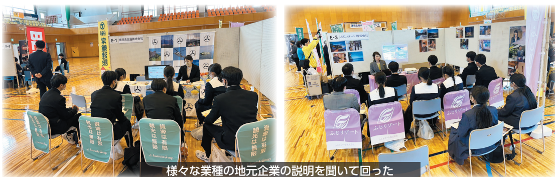
様々な業種の地元企業の説明を聞いて回った

業・建設業・医療福祉・宿泊業等、他業種の企業ごとに設置されたブースを自由に回り、それぞれの概要説明やPRがなされ、進路検討の参考となりました。