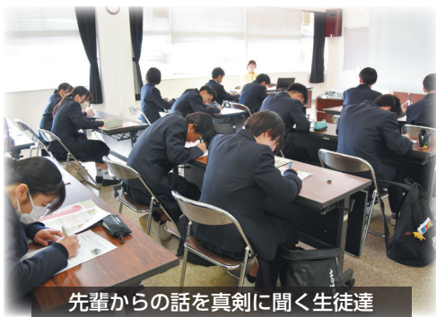
先輩からの話を真剣に聞く生徒達

参加した生徒は、「商工会議所が何をしている場所なのか分からなかったが、企業の支援やイベントなどを行い地域の活性化のために活動を