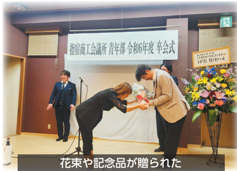
花束や記念品が贈られた

歓談中には、余興や卒会者宛てに作成した思い出の動画を流し、卒会者をもてなしました。