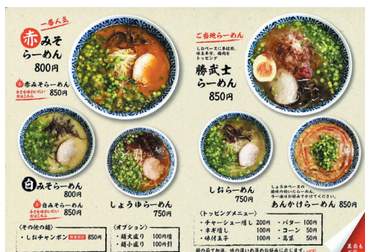
メニューが豊富で様々な味を楽しむ

として作っていた「あんかけらーめん」をメニュー化した他、一番人気の「赤みそらーめん」やご当地グルメである「勝武士らーめん」・「高菜チャーハン」等様々なメニューが揃っており、可能な限り安く提供できるようにしているとのこと。