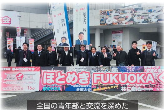
全国の青年部と交流を深めた

2月14日（金）・15日（土）、日本商工会議所青年部第44回全国大会「ほとめきFUKUOKA OKAくるめ大会」が福岡県久留米市で開催されました。 全国各地の青年部メンバーが参加し、多くの人で賑わう中、当所青年部会員からも9名が参加しました。 記念式典や記念講演等が行われ、参加メンバーは真剣に耳を傾けていました。 終了後は、大牟田市へ移動し、大牟田商工会議所青年部と交流会を行い、互いの地域や事業について意見交換を行いました、親睦を深めました。