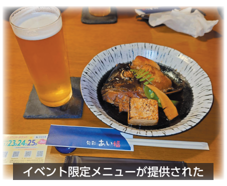
イベント限定メニューが提供された

参加者は、チケットを片手に参加店舗を周り、指宿のグルメを楽しみました。地元民のみならず市外からいぶすきバルを楽しみに来られた方もいらつしました。