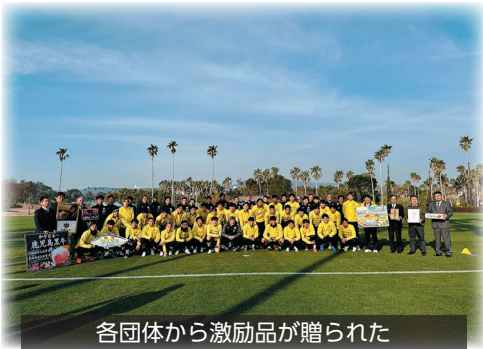
各団体から激励品が贈られた

1月22日（水）、指宿いわさきホテルでプロサッカークラブである柏レイソルと湘南ベルマーレの激励式が行われました。 両クラブは日本プロサッカーのトップリーグ（通称J1）で活躍しており、2月の開幕戦に向けて指宿で強化キャンプを行いました。 激励式当日は、行政や商工団体等の関係者らが出席し、特産物を激励品として両クラブへ贈られ、当所からも、さつま芋を贈りました。 その後、両クラブの選手より感謝の言葉と試合への意気込みが述べられました。