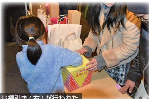
焼酎ふるまい（左）やおみくじ福引き（右）が行われた

れ、今年の干支である巳をモチーフにしたキャラクターに扮したパフォーマンスを見て会場では初笑いの声が響き渡りました。