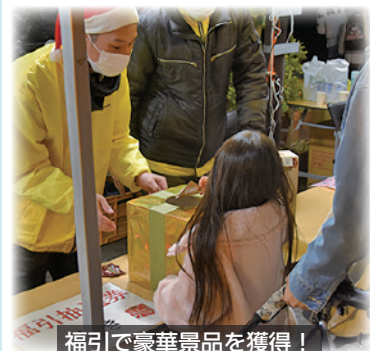
福引で豪華景品を獲得！