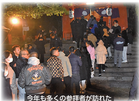
今年も多くの参拝者が訪れた

れ、今年の干支である巳をモチーフにしたキャラクターに扮したパフォーマンスを見て会場では初笑いの声が響き渡りました。