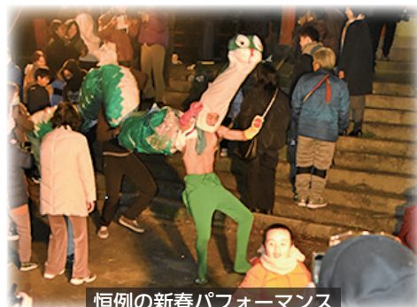
恒例の新春パフォーマンス