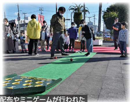
サンタさんによるプレゼント配布やミニゲームが行われた