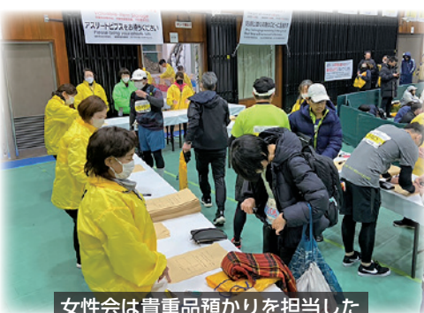
女性会は貴重品預かりを担当した

振舞いのボランティアスタッフとして参加しました。その他多くの当所関係者も実行委員会やボランティアスタッフとして大会を支え盛り上げました。