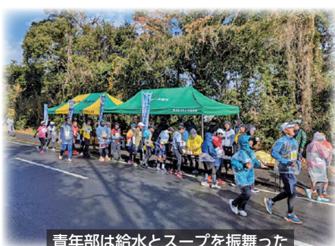
青年部は給水とスープを振舞った