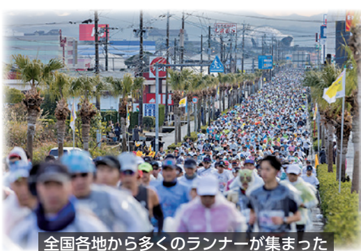
全国各地から多くのランナーが集まった

振舞いのボランティアスタッフとして参加しました。その他多くの当所関係者も実行委員会やボランティアスタッフとして大会を支え盛り上げました。