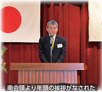
南会頭より年頭の挨拶がなされた

南会頭より年頭の挨拶があり、「2月〜3月には春のグルメ祭りが開催され、2月1日には山川町漁協水揚げ場にてキックオフイベントも行われます。様々な産業が盛り上がり多くの人に指宿を訪れていただきたいと思えます。今年も地域が元気になるような事業に取り組んでまいりますのでよろしくお願ひします。」と挨拶されました。