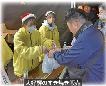
大好評のすき焼き販売

夕方には、限定250食の指宿牛を使用したすき焼きの販売が行われ、販売開始前からすき焼きを買い求めるお客様の長蛇の列ができました。